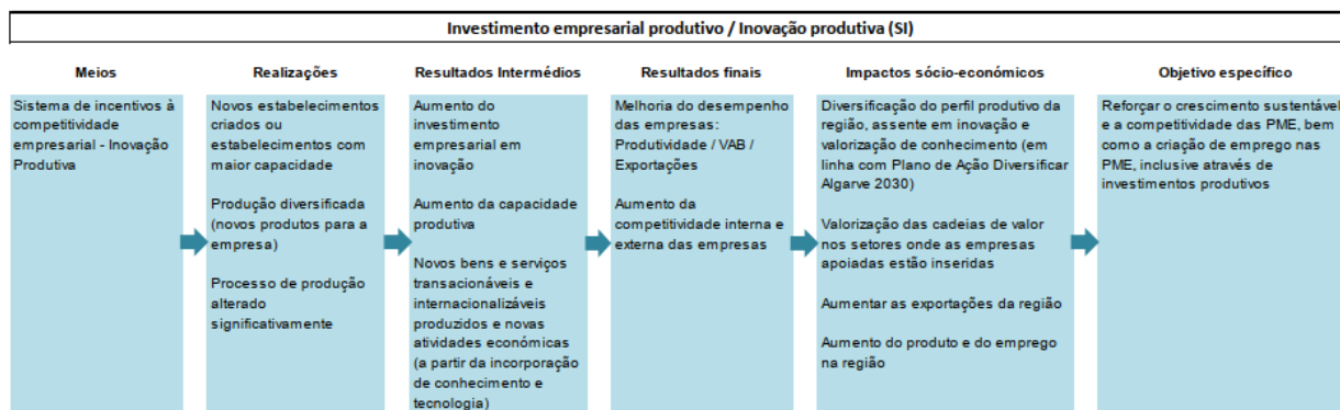
Figura 1. Teoria da Programação - Investimento empresarial produtivo / Inovação produtiva (SI)