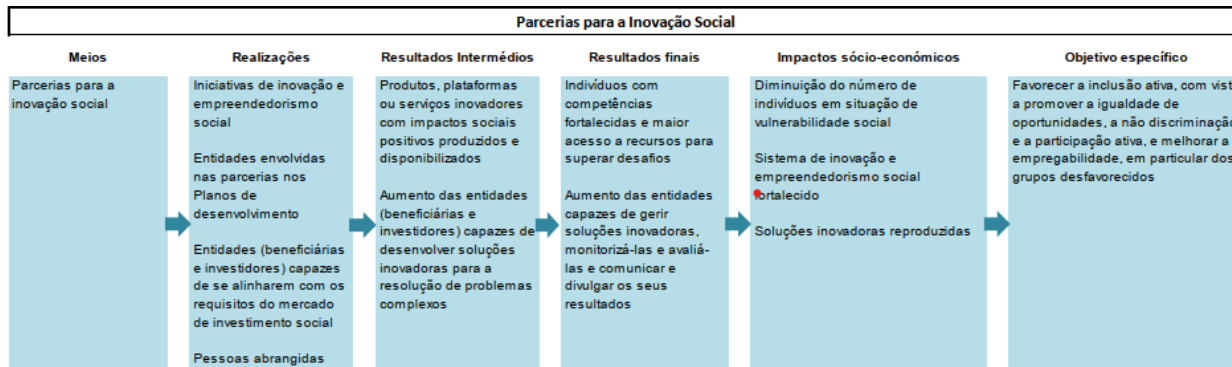
Figura 4. Teoria da Programação – Parcerias para a Inovação Social